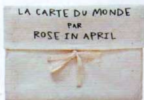
La mappa del mondo Rose in April, 50 euro.