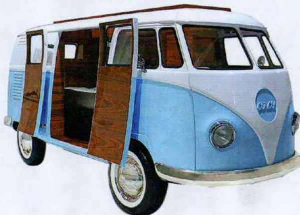
Il letto sulle ruote Circu Magical Furniture, prezzo su richiesta.