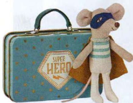
Il compagno di viaggio Maileg, 25 euro.