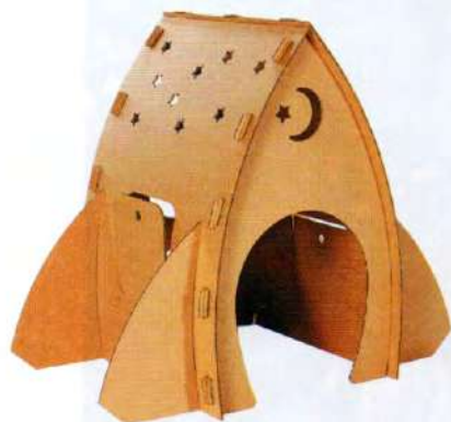
Il razzo di cartone Paper Rocks, Lil'Gaea, 65 euro.

Gli aeroplani crochet Anne-Claire Petit, 42 euro l'uno.