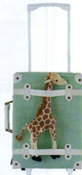
La valigia rétro Olli Ella, 76 euro.