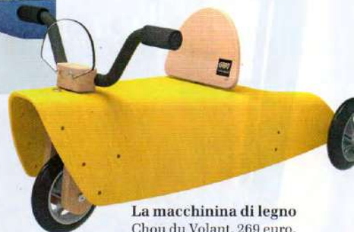
La macchinina di legno Chou du Volant, 269 euro.

Tutto il mondo in una stanza? Oggi ci sta! Ecco tante idee per partire verso nuove avventure e luoghi tutti da esplorare: con una bella dose di fantasia, una mappa in tasca (o appesa al muro) e una valigia sempre pronta!